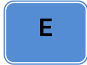
Tabla de referencia de símbolos empleados en esta Guía: