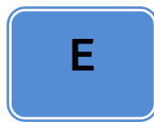
Tabla de referencia de símbolos empleados en esta guía