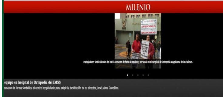
Trabajadores sindicalizados del IMSS accionan falta de equipo y personal en el hospital de Ortopedia Magdalena de las Salinas.

Magdalena de la Salinas del IMSS, opera con aparatos obsoletos en los quirófanos, serías carencias de insumos y de personal. Los médicos sufren de fatiga y rezagos de cirugías hasta por ocho meses de pacientes con afectaciones de columna, cadera, traumatismos craneoencefálicos y con enfermedades de extremidades bajas, por padecer enfermedades de columna.